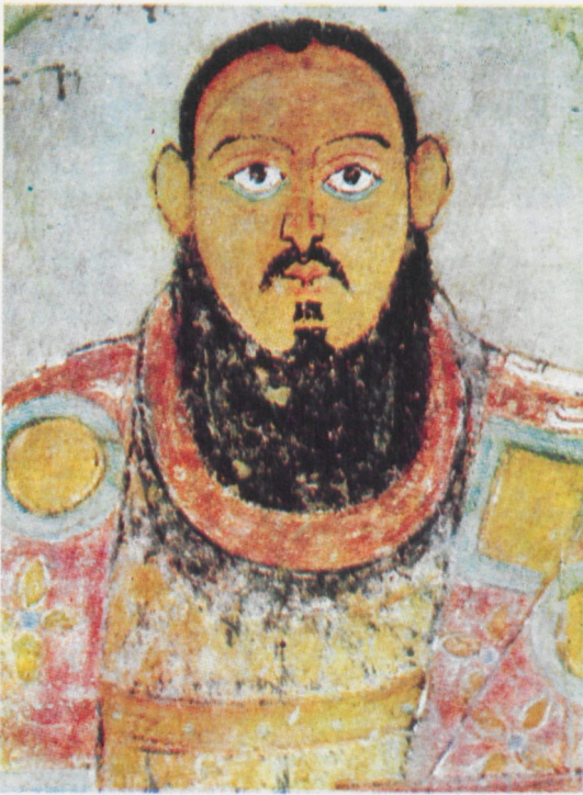
Faras, portrait de l'évêque Marianos