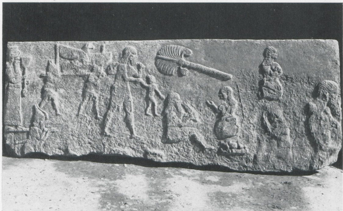
Nimrud, bas-relief du palais d'Assurnapli II