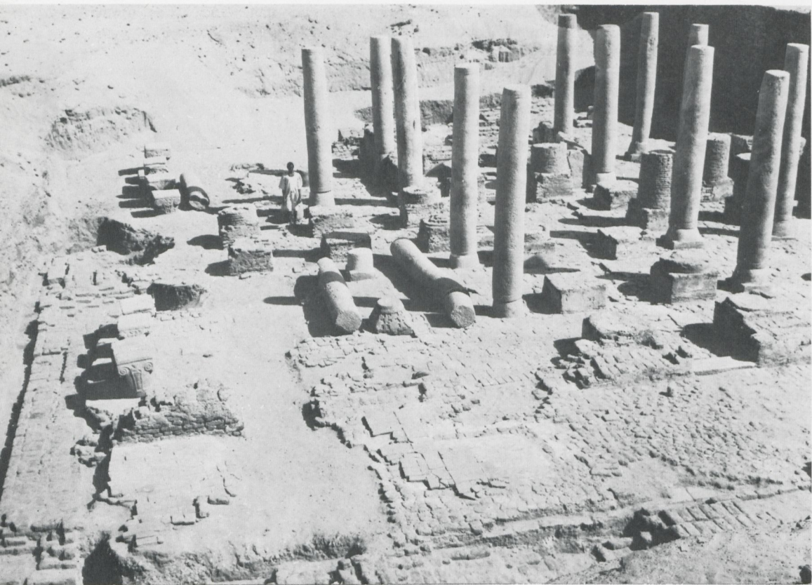
Dongola, l'église à colonnes de granit