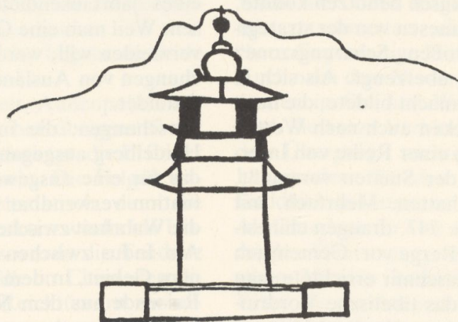
Pagode chinesischen Typs. Felsbild oberhalb der Station Chilas I.

1979 war in Hunza, an dem Weg, der auf die Pässe zuführt, hinter denen Ostturkestan liegt, eine Inschrift bemerkt worden, die ich zunächst für rezent hielt, so gut war der Erhaltungszustand. Ich hatte die Chinesen des großen Bau-