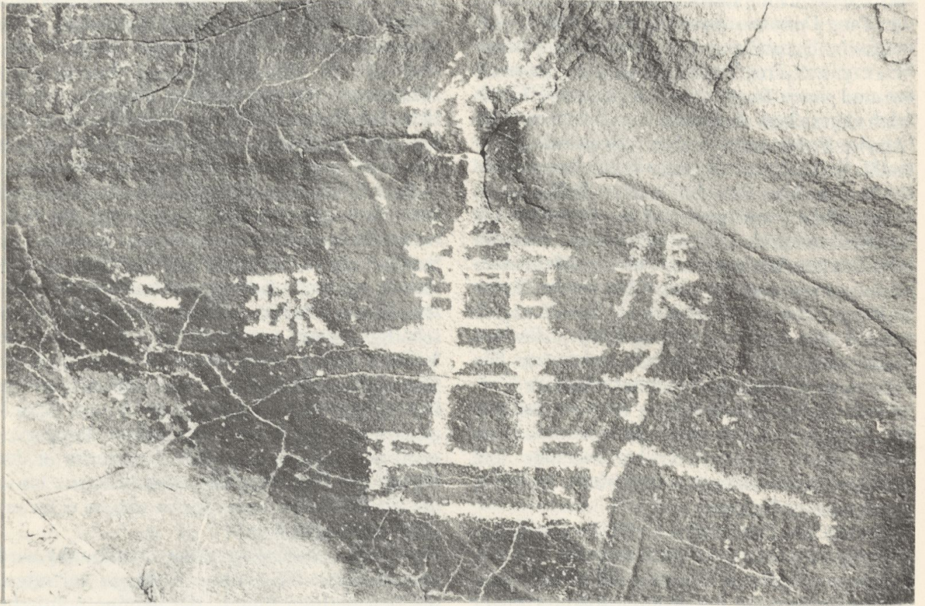
Felszeichnung einer Pagode mit begleitender chinesischer Inschrift. Eingang des Tales von Thak

Eine Pagodenzeichnung am gleichen Weg aber ohne Beschriftung hatte ich bereits vorher photographisch festgehalten.