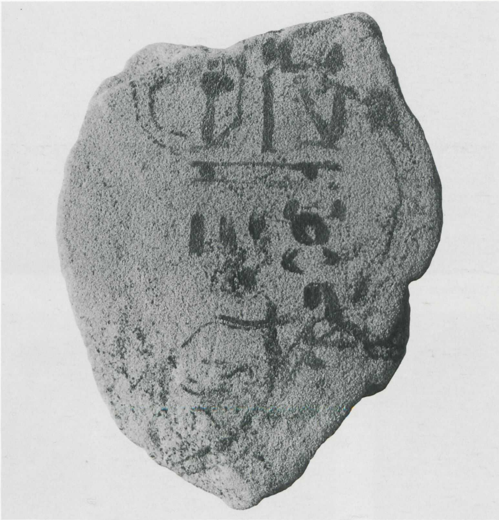
a Ostrakon Qurna 637