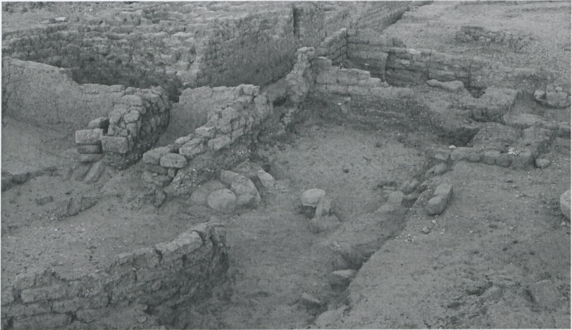
Abb. 3 Keramikansammlung in Planquadrat 180/2270 von SAV1N, Blick nach Nordost