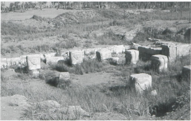
Abb. 4: Ansicht des Hathor-Tempels am Kom el Rabia

Noch heute sichtbar ist ein vor der Südmauer des Ptah-Bezirk liegender, von Ramses II. errichteter Hathor-Tempel am Kom el Rabia, der wegen des Grundwasserspiegels nicht vollständig ausgegraben werden konnte. Entdeckt wurde die Anlage vom ägyptischen Militär beim Ausheben von Luftschutzbunkern im Jahr 1969/70. Der Säulenhof des Tempels war mit insgesamt 16 doppelgesichtigen HathorSäulen ausgestattet, sieben Kapitelle sind heute über dem Bodenniveau zu sehen (Abb. 4). Eventuell ließ Ramses die Anlage im Rahmen eines Sed-Festes (des zweiten?) ausführen.