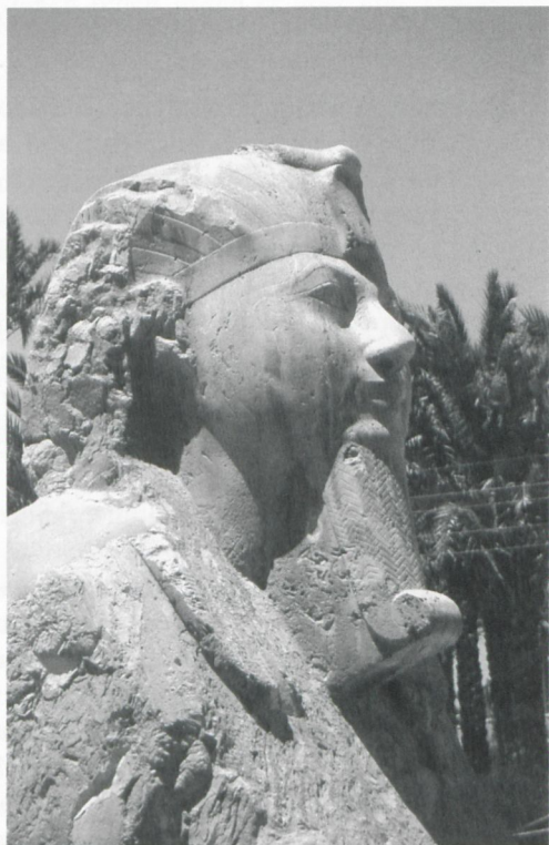
Abb. 3: Alabastersphinx von Memphis

Ramses II. ist für massive Erweiterungen und Neubauten im Bezirk verantwortlich – ihm sind die sog. Westhalle (s.u.) sowie große Teile des an sie anschließenden Baues zuzuschreiben. So fügte er den nördlichen Vorbauten des Ptah-Tempels einen Vorhof mit Pylon an und erneuerte das Sanktuar des Ptah. Ähnlich wirkten alle großen Bauherren am Pharaonenthron im Hauptteil des Tempels und ließen sich in Stein verewigen. Erhalten haben sich von diesen Bauten Reste eines Granittores Ptolemäus' IV. Philopater in der Ostmauer. Am Nordtor wurden noch Fragmente von Statuen sowie ein wiederverwendeter Architrav Amen-em-hats III. festgestellt. Nahe des nördlichen Eingangs fanden sich innerhalb des Temenos mehrere Statuen, darunter eine Gruppenstatue Ramses' II. mit Ptah (heute in Kopenhagen), eine Sphinx desselben Königs (heute in Philadelphia) sowie eine Sitzstatue des Amen-hotep, Sohn des Hapu (heute in Oxford) (PM III, 217f.). Die Inschrift auf diesem Bildnis des Beamten unter Amen-hotep III. beschreibt einen Tempel für Ptah, den der König westlich des Hauptheiligtums errichtete. Der Name dieses Baus lautet Nebmaatre, vereint mit Ptah