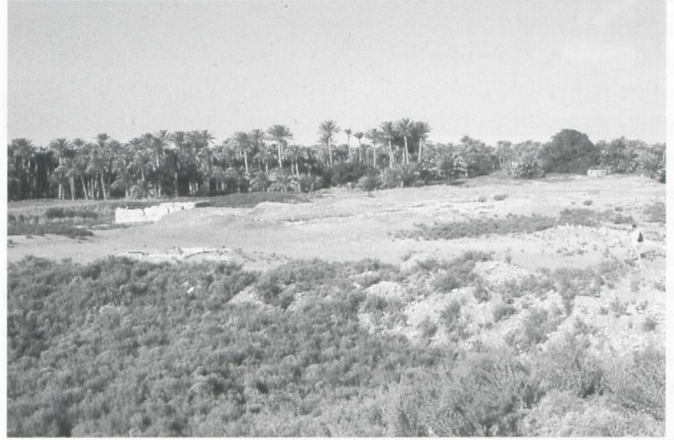
Abb. 1: Blick über das Gebiet des Ptah-Tempels.

allem die Lage von Memphis im Umkreis von Kairo (etwa 15 km) und der nahezu unersättliche Bedarf der mittelalterlichen Stadt an Bausteinen. Zusätzlich verschlimmert haben den Zustand des Ptah-Bezirktes die Ausgrabungsmethoden des 19. Jh.s, die mit gigantischen Suchgräben auch die letzten Spuren unwiederbringlich und gründlich vernichteten.