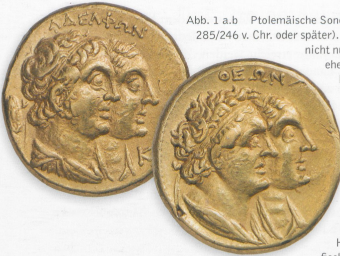
Abb. 1 a.b Ptolemäische Sonderprägung (ausgegeben 285/246 v. Chr. oder später). Das Goldtetradrachmon dürfte nicht nur als Zahlungsmittel, sondern eher als Auszeichnung verdienter Funktionäre gedient haben. Auf der Rückseite sind Ptolemaios I. und Berenike I. dargestellt, auf der Vorderseite deren Kinder Ptolemaios II. und seine Schwestergemahlin Arsinoe II. Die Umschrift liest sich in Kombination von Rück- und Vorderseite als »(Münze) der Geschwistergötter« ( theōn adelphōn ). Beide Herrscherpaare sind ikonografisch durch die weit aufgerissenen Augen und den leicht nach oben gehobenen Blick als vergöttlicht dargestellt. Die Prägung zeigt das Bemühen um dynastische Legitimation der Herrschaft des zweiten Ptolemäers.