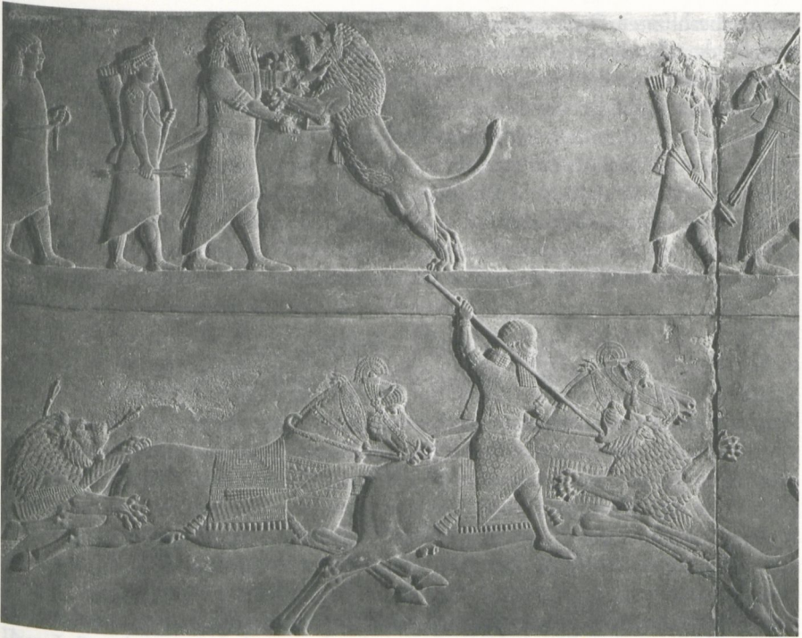
Abbildung 5: Orthostatenrelief des Assurbanipal mit Jagddarstellung, neuassyrisch; entnommen aus: Winfried Orthmann: Der Alte Orient (= Propyläen Kunstgeschichte, Bd. 14). Berlin 1975, Abb. 242, Abb. 243.

garantieren. Bisweilen sah sich der König genötigt, Präventivkriege außerhalb des eigenen Territoriums zu führen, vor allem wenn es der Mehrung des eigenen Reichtums oder der Gewinnung der in Babylonien so seltenen Rohstoffe diente. Es gab sowohl interne Kämpfe zwischen den Stadtstaaten und Kleinfürstentümern Babyloniens in Zeiten interner Fragmentierung, die das Ziel verfolgten, eine hegemoniale Position zu gewinnen, als auch Feldzüge und Expansionskriege, die entweder der territorialen Erweiterung oder auch nur der Gewinnung von Rohstoffen dienten (wie im Zuge des Gilgamesch gegen Humbaba, den Wächter des Silbergebirges und Zedernwaldes beschrieben).