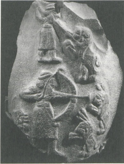
Abbildung 1: Löwenjagdstele aus Uruk, frühsumerisch; entnommen aus: Winfried Orthmann: Der Alte Orient (= Propyläen Kunstgeschichte, Bd. 14). Berlin 1975, Abb. 68.

ist und eben dieses in der folgenden „frühdynastischen Epoche“ des 3. Jahrtausends v. Chr. der offizielle Titel des Herrschers von Uruk war, wird die in der Bildkunst dargestellte Figur als EN identifiziert.