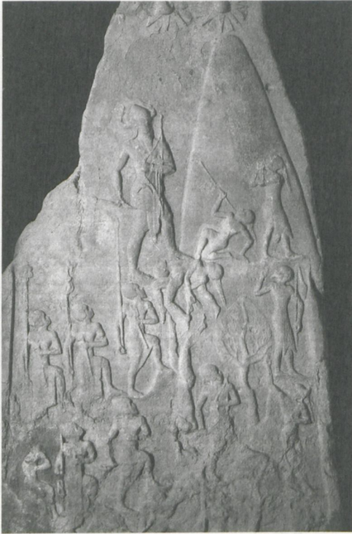
Abbildung 3: Stele des Naram-Sin, akkadisch; entnommen aus: Winfried Orthmann: Der Alte Orient (= Propyläen Kunstgeschichte, Bd. 14) . Berlin 1975, Abb. 104.

Auch wenn das akkadische Reich bei einem Ansturm von Bergnomaden aus dem Zagros in Flammen unterging und hierin von den Bewohnern der sumerischen Städte die gerechte Strafe für die akkadische Hybris gesehen wurde, blieb das akkadische Herrscherprinzip auch für das folgende neusumerische Reich der III. Dynastie von Ur prägend. In diesem fand eine Verknüpfung der traditionellen sumerischen Königsideologie mit der akkadischen statt, wodurch das babylonische Königtum seine endgültige Form annahm.