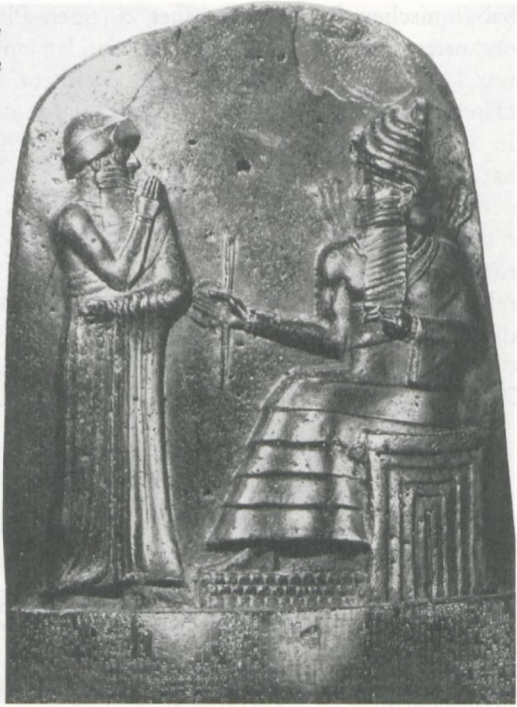
Abbildung 4: Codex Hammurapi, altbabylonisch