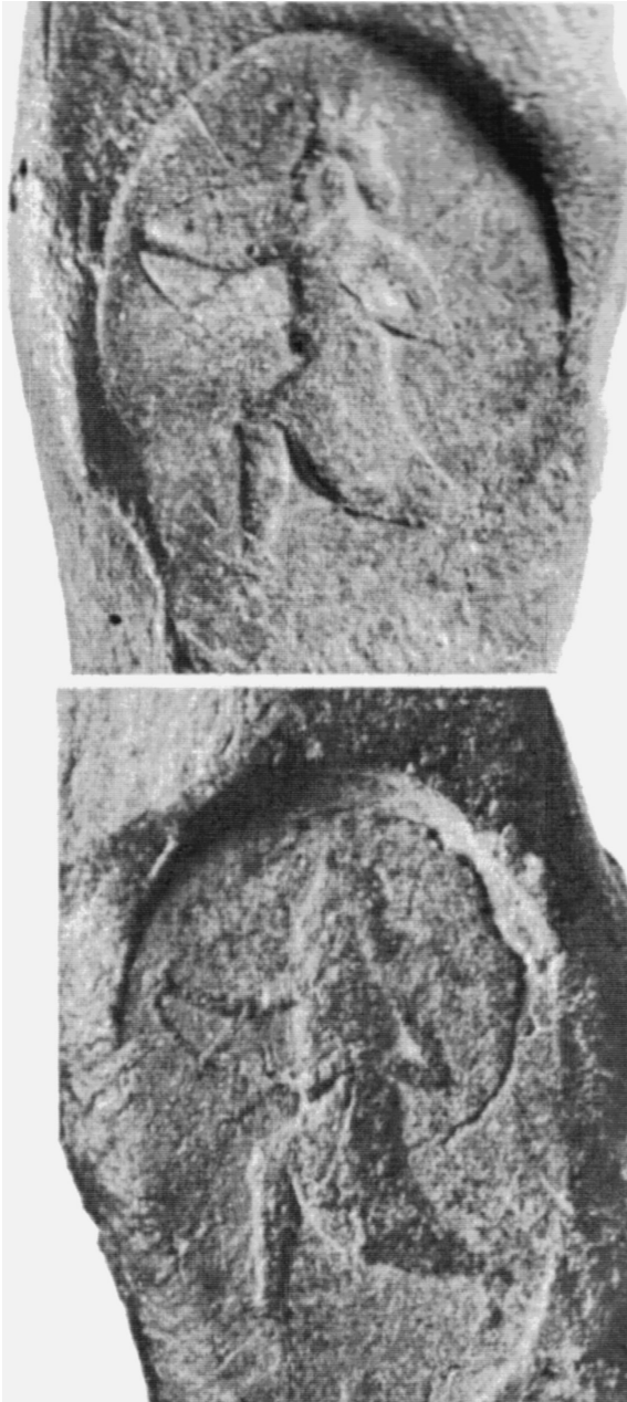
4. Antiker Siegelabdruck aus Persepolis (nach Schmidt 1957, Taf. 13, 58).