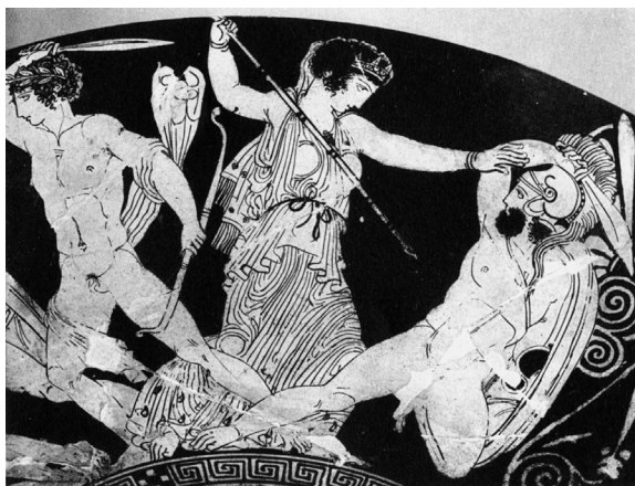
8. Darstellungen auf einer rotfigurigen Schale des Aristophanes-Malers (nach CVA Berlin [3] Taf. 119, 3).