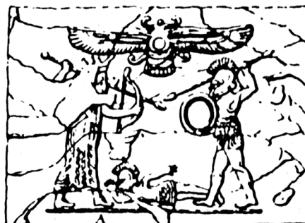
3. Rollsiegel aus Pantikapaion (nach Gow 1928, 157 Abb. 10).