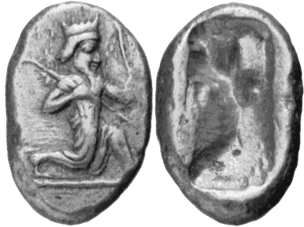
5. Dareikos (nach Weisser 2006, 74 Abb. 8).