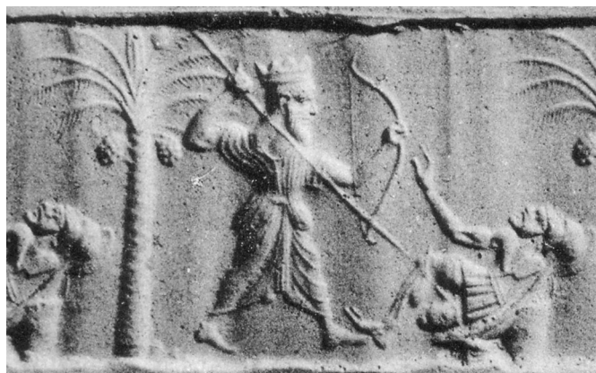
1. Rollsiegel aus der ehemaligen Sammlung Moore (nach Eisen 1940, Taf. 11, 102).