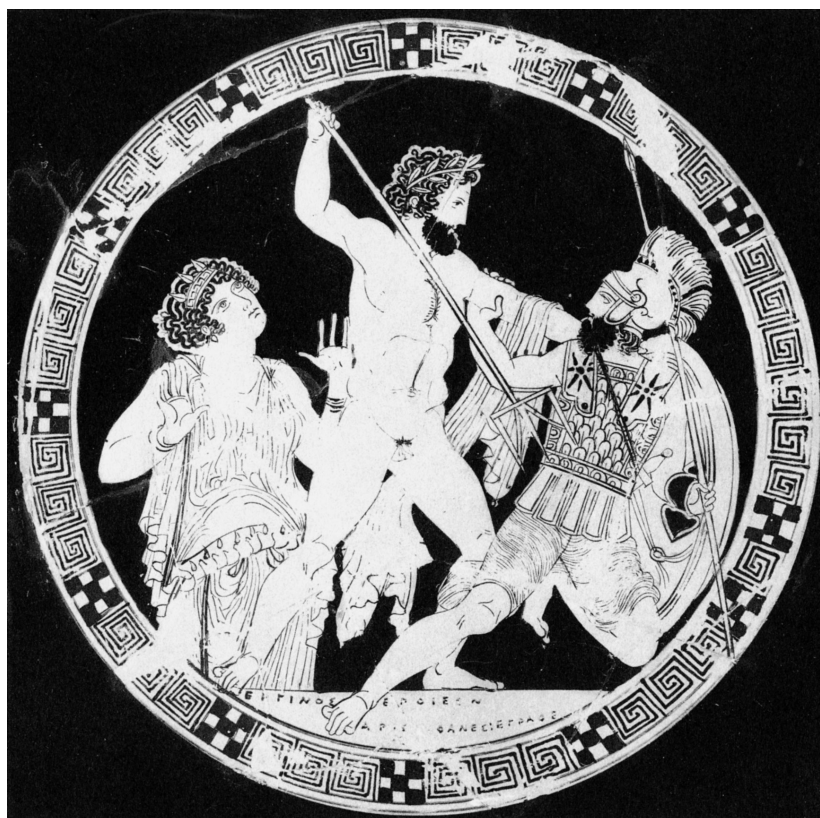
10. Darstellungen auf einer rotfigurigen Schale des Aristophanes-Malers (nach CVA Berlin [3] Taf. 121, 4).