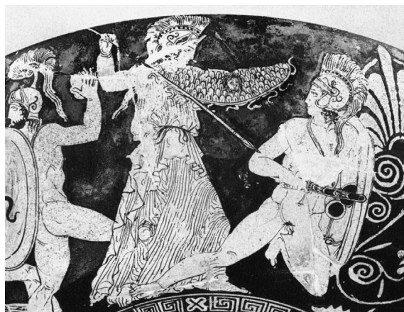
9. Darstellungen auf einer rotfigurigen Schale des Aristophanes-Malers (nach CVA Berlin [3] Taf. 120, 3).