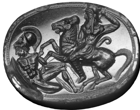
7. Stempelsiegel aus dem Kunsthandel, München.