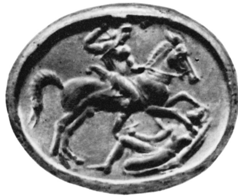
6. Stempelsiegel aus dem Kunsthandel, New York (nach Nikulina 1994, Abb. 517).