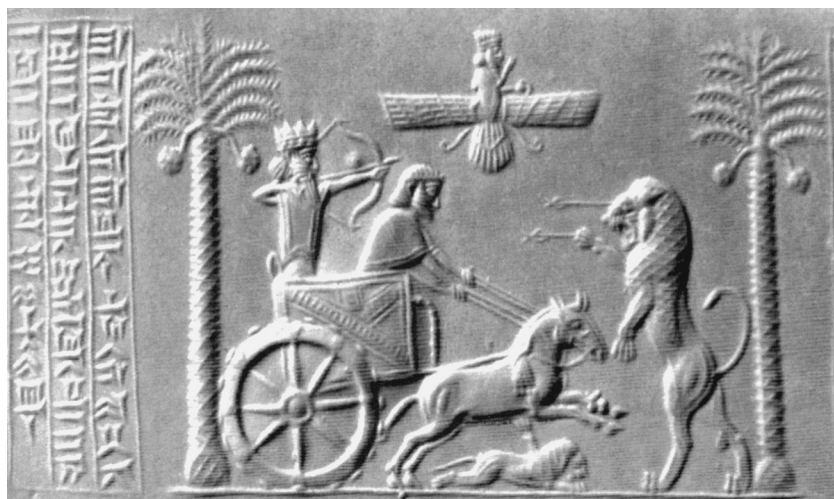
2. Rollsiegel des Dareios mit Herkunftsangabe Ägypten, London (nach Merrillees 2005, Taf. 7 Nr. 16).