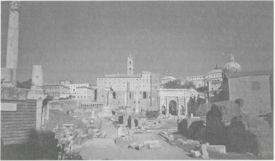
Abb. 17: Das Forum Romanum (Übersicht)

dem Palatin im Süden hatte Romulus die Stadt gegründet, dort zeigte man noch in später Zeit seine Hütte; auf dem Capitol hatte er den zukünftigen Bewohnern Asyl gegeben; und nachdem die Römer sich durch den «Raub der Sabinerinnen» mit frevelhafter Gewalt ihre Frauen verschafft hatten, hatten die Sabiner unter dem König Titus Tatius das Capitol eingenommen. Diese allbekannten Geschichten wurden auf dem Forum durch Erinnerungen ergänzt, die den politischen Konflikt und seine Lösung zum Thema machten. Zur Zeit des Augustus schildert der Historiker Livius (1, 12–13) die anschließende Schlacht vor dem Hintergrund einer höchst detaillierten Topographie: wie die Römer das Capitol bestürmten, dann durch die Senke des Forums bis an das Tor zum Palatin zurückgedrängt wurden; dort habe Romulus für den Fall der Rettung einen Tempel für Iuppiter Stator, den «Aufhalter» (der Feinde), gelobt, worauf die Römer die Sabiner wieder zurückdrängten, bis deren Held Mettius Cürtius sich auf der Flucht in einen Sumpf stürzte; schließlich hätten die Sabinerinnen sich zwischen ihre sabinischen Väter und ihre römischen Ehemänner geworfen und dadurch das Ende des Kampfes, den Abschluß des Friedens und die Vereinigung der beiden Völker zu einer einzigen Gemeinde bewirkt.