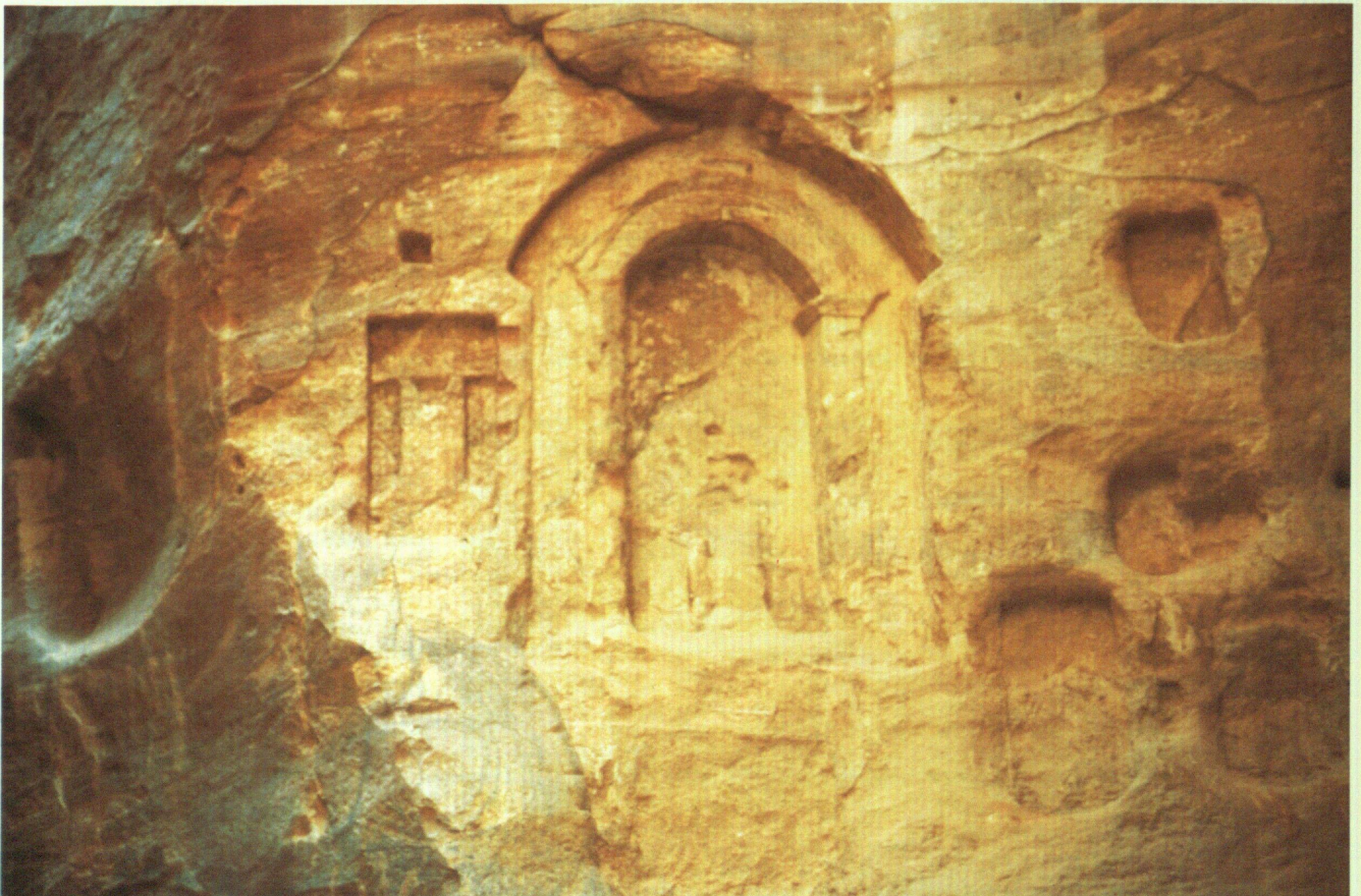
Abb. 114 Petra, Quellheiligtum Sidd al-Ma'āgīn mit Idolnischen (D. 607. 606).

Am jeweiligen Ort stehen meist ein Gott und eine Göttin im Mittelpunkt der Verehrung. Sofern diese funktional die Erwartungen ihrer Anhänger umfassend erfüllten, könnte man in gewisser Weise von einem «Hochgott» bzw. einer «Hochgöttin» sprechen. Allerdings fehlt das Pantheon, über das Hochgottheiten ansonsten ( per definitionem ) erhaben sind; denn ein Pantheon im Sinne einer