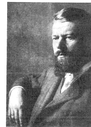
Max Weber (1864–1920)