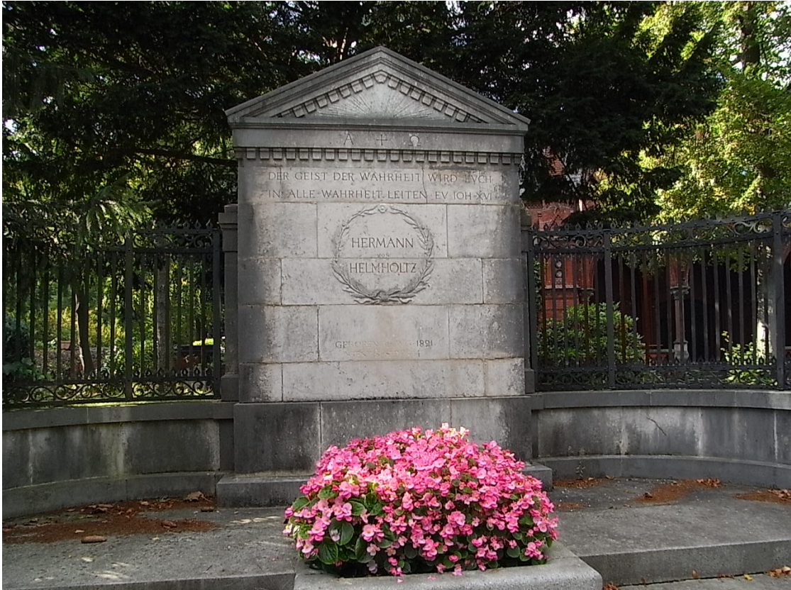
Grab Hermann von Helmholtz' auf dem Friedhof Berlin-Wannsee

Am Morgen des 8. September hauchte Hermann von Helmholtz sein irdisches Leben aus.