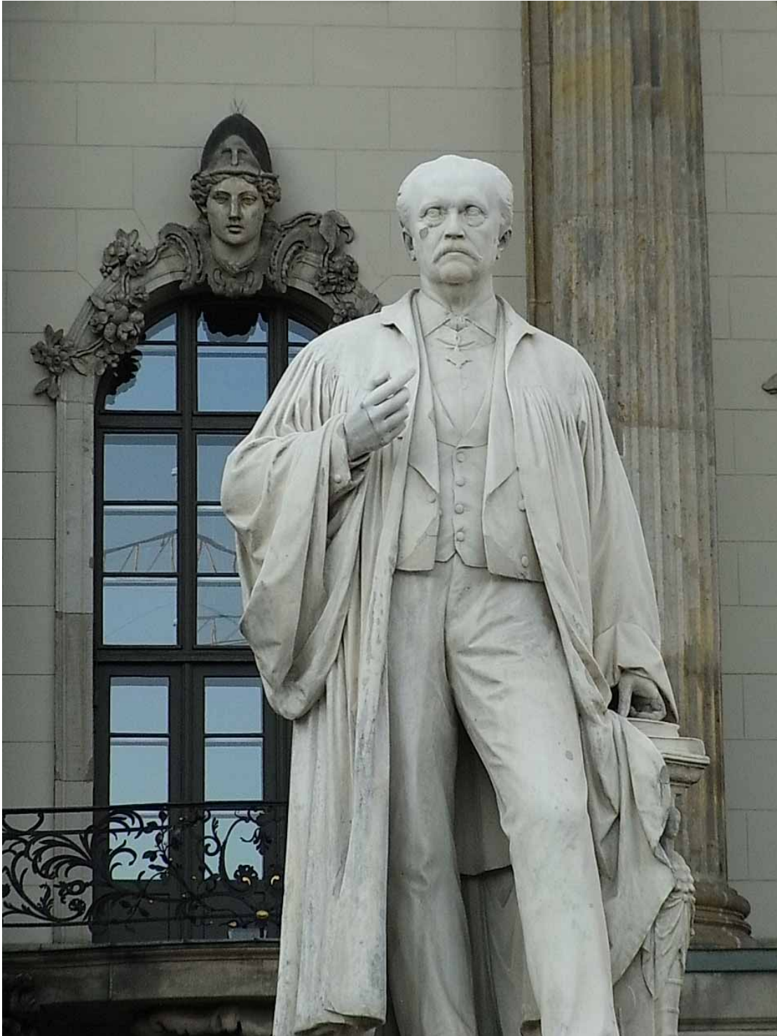
Helmholtz-Denkmal vor der Berliner Humboldt-Universität