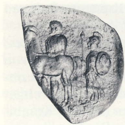
Abb. 203 Fragment einer gelben Glaspaste. Römer mit Pferd und Roma. Kopenhagen, Nationalmuseum. (n. Vollenweider, Portraittgemmen Taf. 7,8)