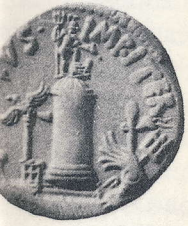
06 Denar des Sextus us, zw. 38 und 36 v. zilen. Leuchtturm von a mit Neptun und aleere. (n. Grueber Nr. 18 Taf. 120,13)

bezogen werden Wandel von der und schlagartig, dessen man sich kanischer Tradi- tze machte.