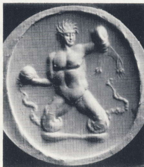
Abformung von Kat. 253