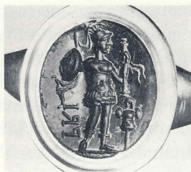
Abb. 204 Karneol: Feldherr neben Tropaeum. Wien, Kunsthistorisches Museum Inv. IX B 370. (n. Zwierlein-Diehl, AG-Wien II Nr. 1096 Taf. 84)