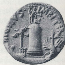
Abb. 206 Denar des Sextus Pompeius, zw. 38 und 36 v. Chr. Sizilien. Leuchtturm von Messana mit Neptun und Kriegsgaleere. (n. Grueber II 563 Nr. 18 Taf. 120,13)

führte, die schon von vornherein auf niemand anderen als den neuen princeps bezogen werden konnten. Dieser bildliche Wandel, der letztendlich auch den politischen Wandel von der Republik zum Prinzipat widerspiegelt, vollzog sich dabei keineswegs abrupt und schlagartig, sondern in einem allmählichen aber stetigen Entwicklungsprozeß, innerhalb dessen man sich immer wieder bereits fest in dieser Denkmälergattung etablierter spätrepublikanischer Traditionen bediente und sich somit auch die Bekanntheit einzelner Motive zunutze machte.