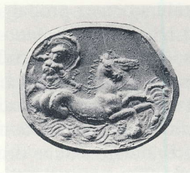
Abb. 205 Gelbbraune Paste: Poseidon mit Hippokampenbiga. Ost-Berlin, Antiquarium (A Furtwängler, Beschreibung der geschnittenen Steine im Antiquarium [1896] Nr. 6256 Taf. 43)