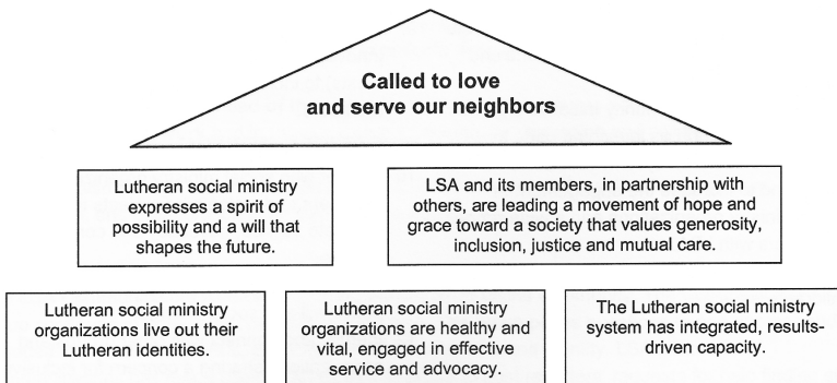
Abb. 2: mission end policies von LSA bis August 2013 25

Die Werte einer Organisation äußern sich am deutlichsten in ihrem kommunizierten Leitbild. Hier sind starke Entwicklungen innerhalb der Organisation im Lauf der Zeit festzustellen, die ich kurz am Beispiel des Führungskräftewechsels im Jahr 2012 hervorheben möchte. Unter der Führung von Jill Schumann existierten von 2008 bis 2012 noch so genannte mission end policies , die im nachfolgenden Schaubild verdeutlicht werden.