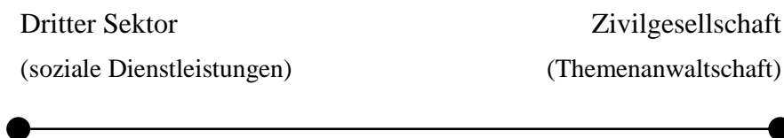
Abbildung 2: Idealtypisches Spektrum gemeinwohlorientierten Handelns

Die vorliegende Studie argumentiert, dass sich Strukturen der Zivilgesellschaft und des Dritten Sektors in Russland zwischen zwei Polen verorten lassen: der Dritte Sektor als sozialer Dienstleister und Organisationen der Zivilgesellschaft als Themenanwälte.