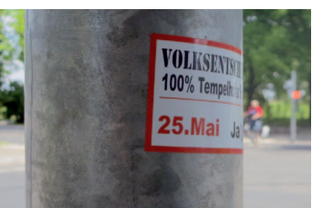
Der Berliner Bürgerprotest zeigt deutliche Spuren

Aus diesem Grund gründete sich 2011 die Bürgerinitiative „100% Tempelhof“, deren Ziel es war, das Feld umfänglich als Park- und Freifläche zu erhalten. Als der Senat im September 2013 einen „Masterplan“ zur Randbebauung des Feldes mit Wohnungen, einer neuen Landesbibliothek sowie einigen Gewerbeeinheiten präsentierte, setzte sich 100% Tempelhof – inzwischen von einigen Parteien und großen zivilgesellschaftlichen (Umwelt-)Organisationen unterstützt – für einen Volksentscheid ein. Am 25. Mai 2014 stimmten 64 Prozent der WählerInnen für den Erhalt des Tempelhofer Feldes und lehnten damit die Senatspläne mit großer Mehrheit ab.