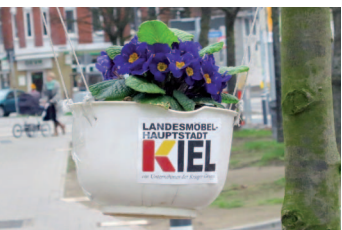
Kreativer Protest in Kiel

Die Stadt Kiel veräußerte Ende 2011 eine Kleingartenkolonie, den Prüner Gang, an einen privaten Investor, der das Gelände gewerblich erschließen wollte. Der Investor präsentierte Ende 2012 seine Pläne für ein 40.000 qm großes Möbelhaus, ein Vorhaben, das zunächst parteiübergreifend im Stadtrat unterstützt wurde, da es in der strukturschwachen Region Arbeitsplätze schaffen und Gewerbesteuer einbringen würde. Lediglich DIE LINKE und die neu gegründete Partei „Wir in Kiel“ lehnten das Projekt ab, aus Sorge, das neue Kaufhaus könne zu Lasten kleiner Läden in der Innenstadt gehen. Zudem formierte sich seit Bekanntwerden der Pläne im Jahr 2013 Protest bei den unmittelbaren AnwohnerInnen, den KleingartenbesitzerInnen sowie einigen NaturschützerInnen aus der Region. Die BürgerInnen führten gemeinsam mit zivilgesellschaftlichen Organisationen den ersten Bürgerentscheid in der Geschichte der Stadt Kiel herbei, der im März 2014 parallel zu den Kommunalwahlen abgehalten wurde. Das Ergebnis: 52 Prozent der KielerInnen votierten für die Baupläne des Investors, der Bürgerentscheid scheiterte also.