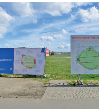
Aushang der (gescheiterten) Senatspläne kurz vor dem Bürgerentscheid in Berlin

„Ich möchte mehr Mitsprache; es geht darum, sich nicht alles aufdrücken zu lassen“ (Betroffene in Berlin).