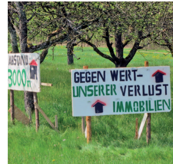
Die Sorge um finanzielle Verluste sind wichtiges Argument im Remstal