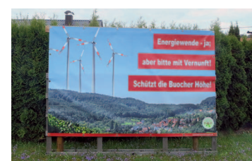
Plakat der Bürgerinitiative im Remstal