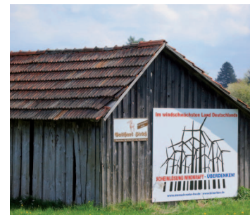
Windmesswerte – Eine Glaubensfrage im Remstal?