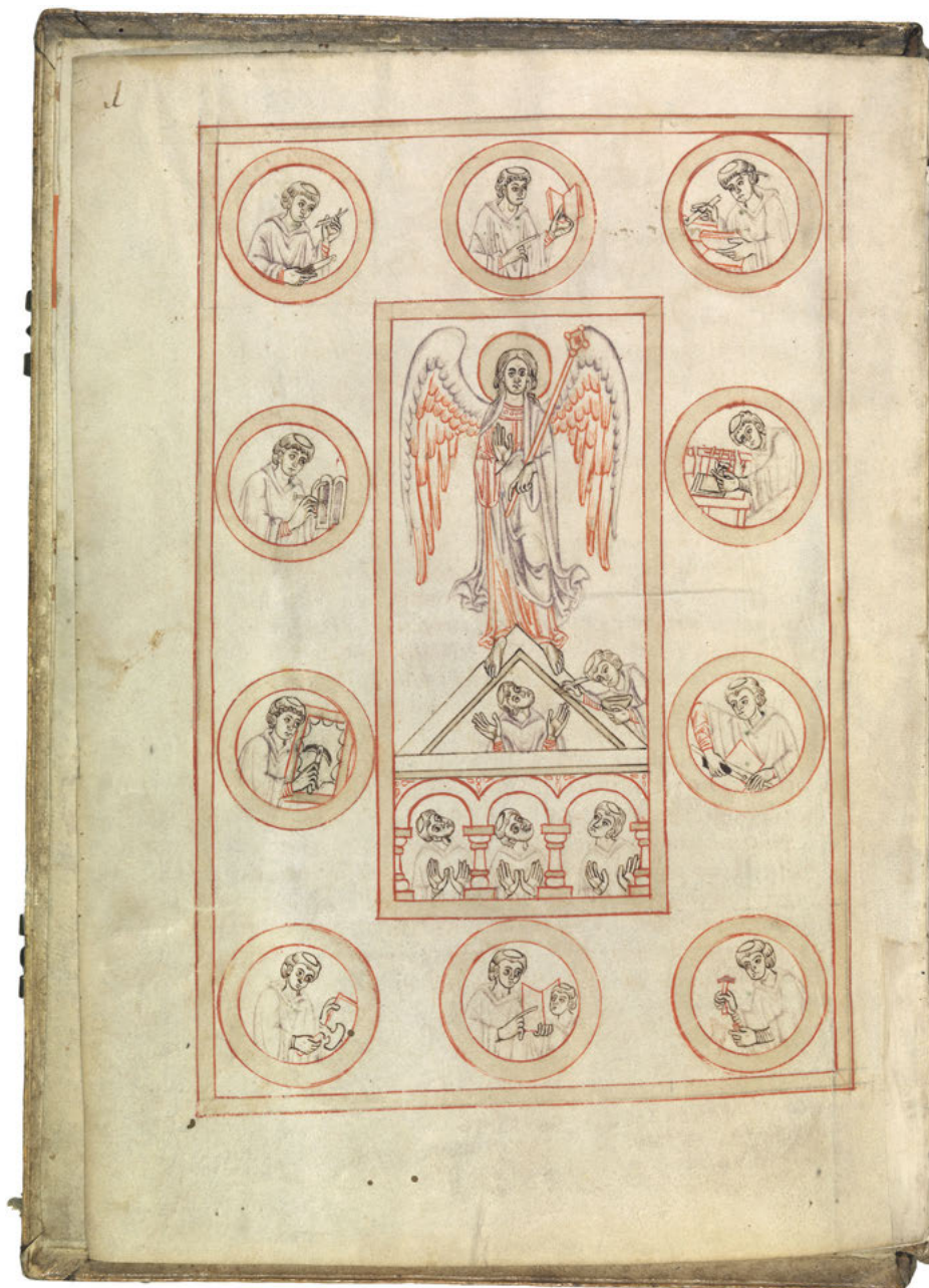
Abb. 3: Die Buchmanufaktur des Klosters Michelsberg in Bamberg.