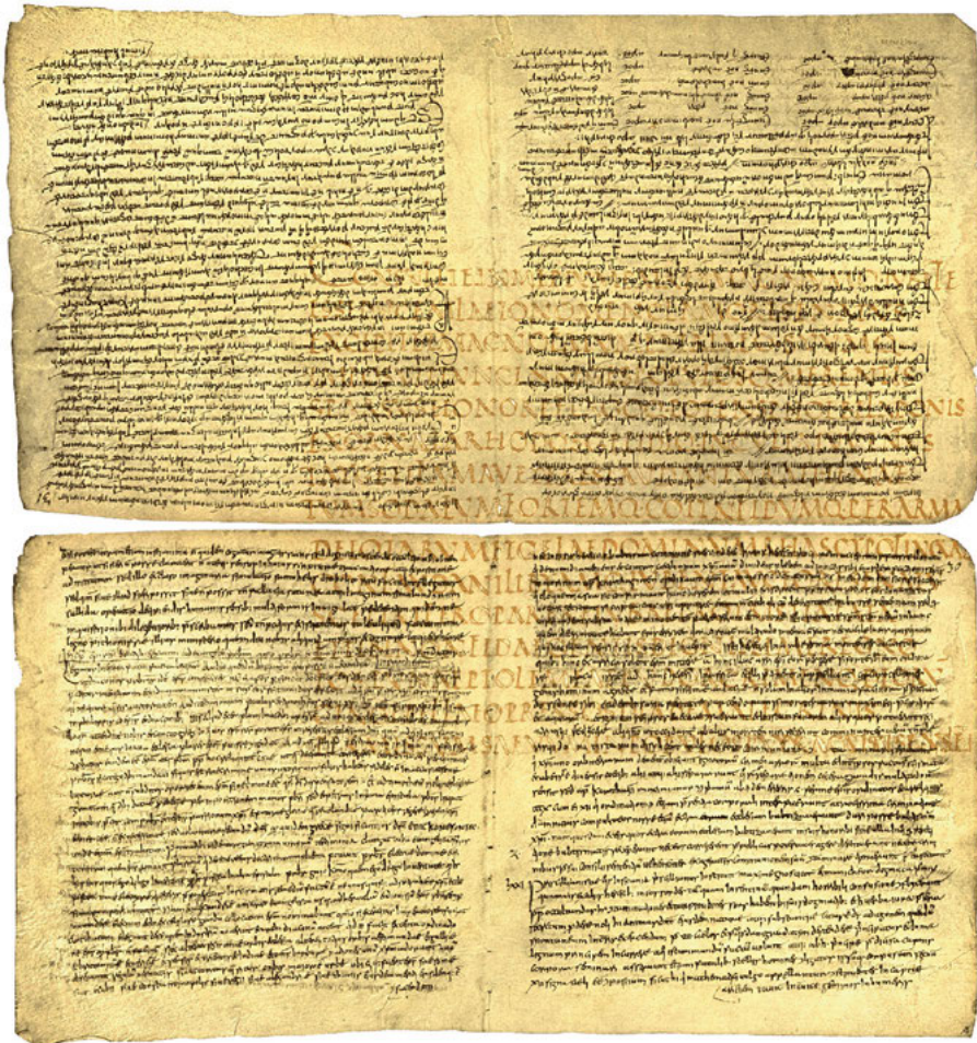
Abb. 1: Ursprünglich großformatige (36 x 38 cm) Lucanhandschrift in Capitalis rustica des 5. Jahrhunderts (CLA: „saec. IV“), die im 8. Jahrhundert in Bobbio mit verschiedenen patristischen Texten reskribiert wurde (aus Beer 1913, Tafel 27, 28. CLA III, 392; Neapel, Biblioteca Nazionale, lat. 2 (Vindobon.16) + IV. A. 8., fol. 31r, 33v, 35v, 30r).

erhaltene Pergamenturkunde in das Jahr 685 datiert. 22 Mit ihr setzt die dichte Überlieferung des erzbischöflichen Archivs von Lucca ein, und man darf konjizieren, dass