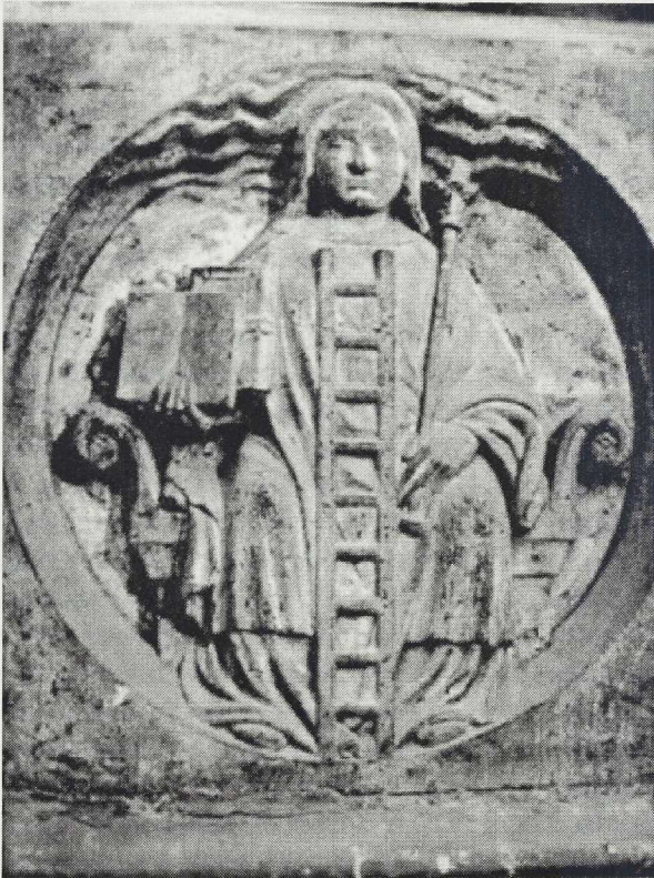
Scala philosophorum (Abb. 1)

In Hugos Notre-Dame-Roman bezieht sich der Erzähler immer wieder auf den in die inneren und äußeren Wände der Kirche eingeschriebenen Alchemistendiskurs. In einem der Türme hat der finstere Erzdiakon und Alchemist Claude Frollo sein Labor, das der Erzähler mit Rembrandts berühmter, nachträglich als Faust-Darstellung gedeuteter Radierung eines in