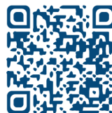
Abb. 3: QR-Code der URL https://www.umm.uni-heidelberg.de/bibl/pcbelegung

Die Übersicht in der Webseite orientiert sich am Grundriss der Bibliothek. Da es in einem Anbau noch einen PC-Pool gibt, der vorrangig für Schulungen vorgesehen ist, wird auf der Webseite noch die Kursbelegung aus dem LSF-System (Lehre, Studium, Forschung) tagesaktuell als Auszug eingeblendet. Die Webseite ist responsiv gehalten, so dass auch das Abrufen und Anzeigen auf einem mobilen Endgerät funktioniert. Im Eingangsbereich der Bibliothek wurde ein Rechner mit Monitor sichtbar aufgestellt, so dass jeder hereinkommende Benutzerinnen und Benutzer sich ohne viel Suchen einen Überblick über die PC-Belegung verschaffen kann. Mittels eines QR-Codes der Webseiten-Adresse kann man Benutzern und Benutzerinnen mit mobilen Endgeräten die Eingabe der Web-Adresse erleichtern.