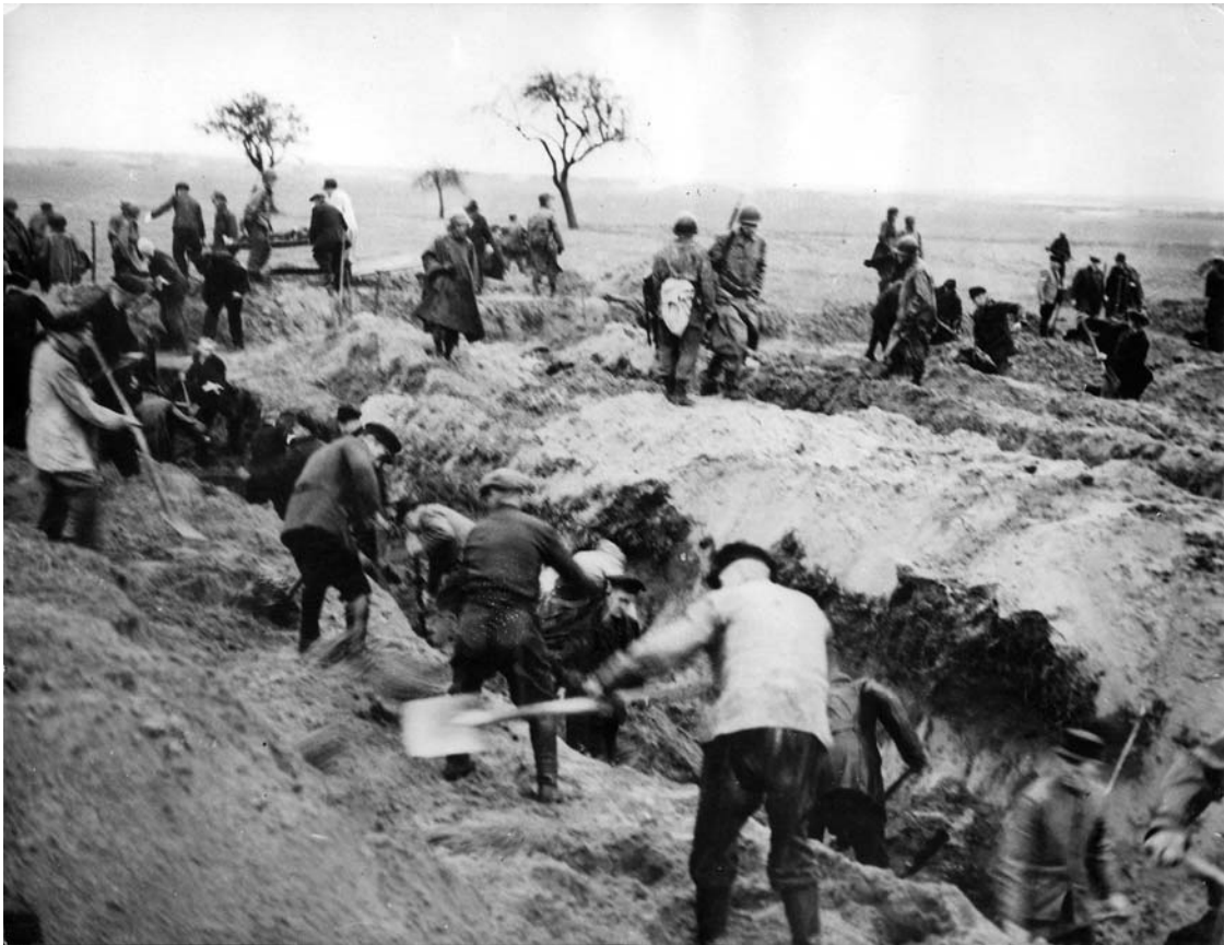
Abb. 6: Gardelegener heben in den ersten Tagen Massengräber aus, in denen die Opfer bestattet werden sollen.

Dieses Foto ist am 18. oder 19. April 1945 aufgenommen worden. Nach Ablauf dieser zwei Tage müssen die Beerdigungen der Ermordeten in Massengräbern unterbrochen werden. Die bisherigen Bestattungsarbeiten der Gardelegener erweisen sich durch einen neuen Befehl bis auf die Identifizierungen der Toten als ungenügend. Der neu ausgesprochene Befehl fordert, die Ermordeten nicht, wie bisher vorbereitet, in Massengräbern, sondern nun einzeln an einem neuen Ort zu bestatten. Die veränderte Befehlslage führt den Gardelegener Männern noch einmal deutlich die Autorität der Besatzer vor Augen. Sie verfügen, wer zu diesen Beerdigungen herangezogen wird, wie diese abzulaufen haben und wann sie zu beenden sind. Diese exekutive Autorität wird durch die moralische zementiert: Sie legen nicht nur das moralische Verständnis von Opfer und Täter, von Gut und Böse fest, sondern können zugleich Strafen und Sanktionen formulieren und durchsetzen. Ihre Autorität, das ist durch die Analyse der Fotos verdeutlicht worden, demonstrieren sie in der Art und Weise ihrer Präsenz während des täglichen Ganges zur Feldscheune und während der Bestattungen. Es ist nicht bekannt,