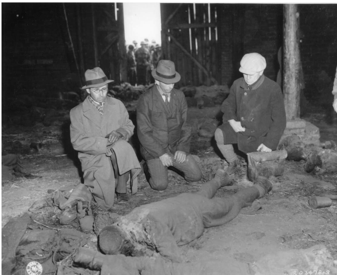
Abb. 2: Drei Bürgermeister aus der Gemeinde Gardelegen werden in die Feldscheune geführt. U.S. Holocaust Memorial Museum, Sign. 45438.

Boden hat, diesmal das rechte, unterscheidet sich mit seiner Brille, dem langen eleganten Mantel, dem Schal und der Krawatte äußerlich von den beiden anderen Männern. Sein Gesicht und sein Blick sind für den Betrachter sichtbar, obwohl er nach unten schaut. Er scheint über die Leiche hinweg auf einen Punkt hinter ihr zu schauen. Er trägt Lederhandschuhe. Die Hände liegen auf dem Knie des linken aufgestellten Beins. Seine Pose und sein Ausdruck wirken demütig, als ob er eine eingeübte Betroffenheit perfekt vorführen wolle.