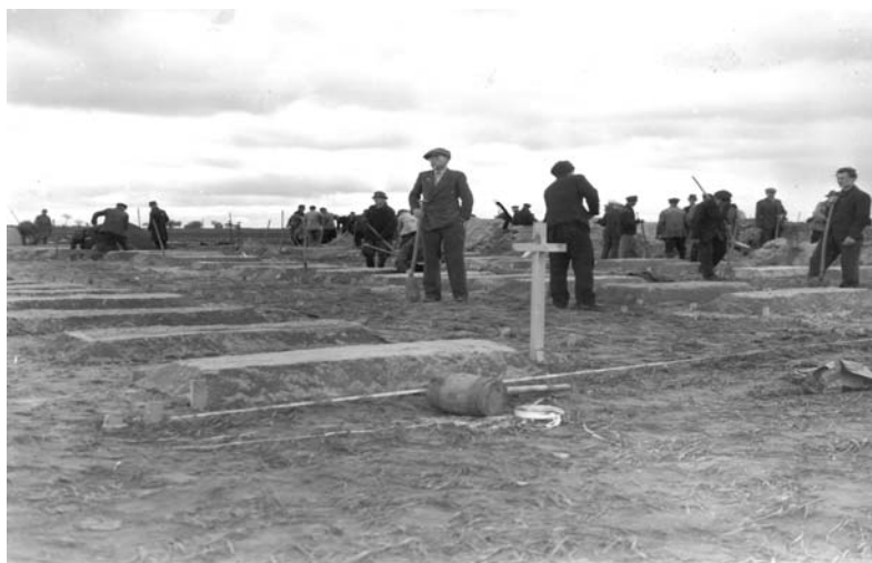
Abb. 8: Die Opfer des Massakers sind in Einzelgräbern bestattet. U.S. Holocaust Memorial Museum, Sign. 81371.

In der letzten hier ausgewählten Aufnahme der Serie von Gardelegen wird der neue Friedhof errichtet (Abb. 8). Die neben- und hintereinander in genauen Abständen aufgereihten Gräber scheinen sich unendlich über das ganze Feld zu erstrecken. Im Hintergrund sind mehrere Männer zu sehen. Einige sind noch beschäftigt, andere unterhalten sich in Gruppen. Wieder andere stehen vereinzelt herum und schauen nach vorn. Über ihren Köpfen ist der bewölkte Himmel zu sehen, in der Ferne im oberen Bild Drittel einige Bäume.