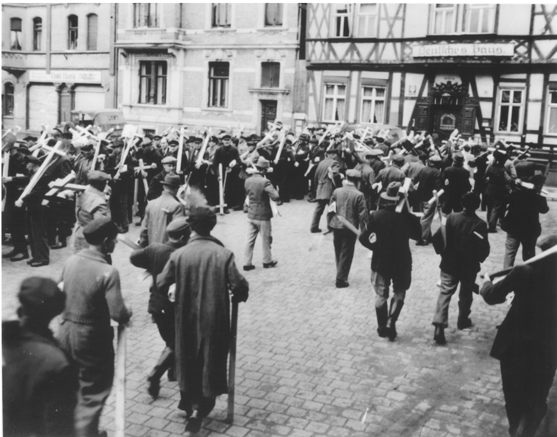
Abb. 7: Für den Dokumentarfilm „Todesmühlen“ schultern Gardelegener weiße Holzkreuze. U.S. Holocaust Memorial Museum, Sign. 83414.

Das folgende Foto zeigt eine Szene, in der sich die Gardelegener für die Filmkamera formieren (Abb. 7). Der Großteil der Männer hat sich in einer unregelmäßigen Reihe in der hinteren, oberen Bildhälfte aufgestellt und die Kreuze erhoben. Sie warten auf die restlichen Männer, die zum Ende der Reihe laufen, um sich dort einzureihen. Vom unteren Bildrand laufen von beiden Seiten vereinzelt Männer auf die Menge zu, um sich hinten anzustellen. Sie gehen auf dem Steinpflaster mit dem Rücken zum Betrachter gewendet und bilden eine diagonale Fläche von rechts unten nach links hinten. Einige stützen sich beim Gehen auf die großen, schlichten Holzkreuze. Im oberen Bild Drittel sind die unteren Stockwerke von Fachwerkhäusern zu sehen. Das rechte trägt den Schriftzug Deutsches Haus .