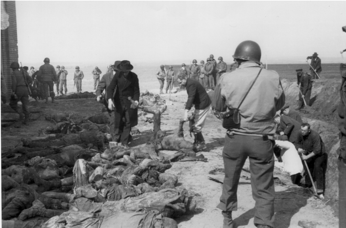
Abb. 4: Mit bloßen Händen bergen Gardelegener Opfer des Massakers.

Im linken, oberen Bereich des Bildes steht eine Gruppe GIs mit den Gesichtern direkt zum Betrachter gerichtet. Sie überwachen einige kaum sichtbare Zivilisten, die eine Leiche wegtragen und sind etwas von einem GI verdeckt, der vor ihnen steht. Neben ihnen liegen weitere Leichen. Einer der Soldaten hält die Kamera hoch, andere GIs beobachten die Szene. Ihre Gewehre sind demonstrativ sichtbar, hängen auf dem Rücken oder werden mit einem Arm nach unten gehalten. Einige Meter weiter unten im Bild läuft ein GI, ebenfalls mit seinem Gewehr auf dem Rücken, zum Lagergebäude. Auf der rechten Seite, in der gleichen Höhe wie die anderen GIs steht ein Dutzend Soldaten, eine geschlossene Gruppe. Durch die Gewehre, die über den Schultern hängen, erscheint ihre selbstbewusste Präsenz verstärkt. In ihren Körperhaltungen drücken sie aus, gleichfalls Beobachter oder Besucher des Geschehens zu sein. 48 Links vor ihnen, in der Verlängerung der bereits beschriebenen eher anonymen Masse von Körpern, zieht sich eine Reihe von Leichen bis über die Mitte des Bildes hinaus. Einige GIs sehen aus, als ob sie sich unterhielten und zu den Männern, die unter ihnen die Felder in Gräber umwandeln, schauen würden. Diese Männer arbeiten verteilt