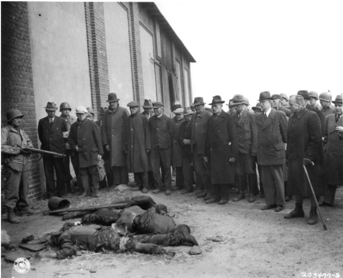
Abb. 1: Gardelegener werden mit der Tat und den ermordeten Opfern konfrontiert. U.S. Holocaust Memorial Museum, Sign. 76687.

Rechts daneben steht ein Mann, der am linken Arm ein Band mit einem Kreuz trägt, also wahrscheinlich zur ärztlichen Versorgung des Roten Kreuzes oder zu einer ähnlichen Einrichtung gehört 37 und damit den Siegermächten zuzurechnen ist. Er hat die Arme auf dem Rücken, trägt einen Anzug, und eine Krawatte, ist also verhältnismäßig gut gekleidet und schaut musternd auf die Leichen hinunter. Hinter ihm steht ein GI mit strengem Gesichtsausdruck und halb geschlossenen Augen. Die letzte Gruppe sieht zum vorderen GI mit dem ausgestreckten Gewehr hin. Der Mann, der neben dem ohne Hut und mit Spazierstock rechts vorne steht, scheint mit ihm Blickkontakt aufzunehmen. Die Männer in der Mitte der ersten Reihe schauen ihn an als würden sie auf eine Anweisung von ihm warten. Somit wird die Machtstruktur zwischen dem GI und den Zivilisten entsprechend als eine zwischen Machthaber und unterlegener Bevölkerung dargestellt.