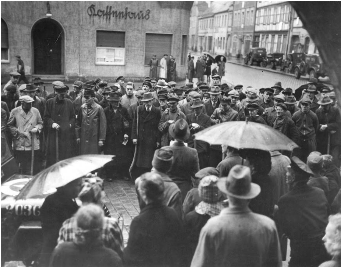
Abb. 3: Versammlung von ca. 200 Männern auf dem Gardelegener Rathausplatz.

Die Männer stehen eng gedrängt in etwa vier unregelmäßigen Reihen und vertreten sehr unterschiedliche Altersgruppen. Ihre unbeteiligten, hölzernen Gesichtsausdrücke, ihre gesenkten Körperhaltungen, ihre gebeugten Schultern, ihre herunterhängenden Arme und ihre aufeinandergelegten Hände drücken Kraftlosigkeit und Niedergeschlagenheit aus. Ihre abwartende Haltung signalisiert eine gewisse Gehorsamkeit und Unterwürfigkeit, die vielleicht auf die Ergebenheit der Bevölkerung hinweist. Die Köpfe einiger Männer sind abgewendet, als würden sie sich unterhalten. Manche von ihnen schauen nach unten, andere blicken zur Seite und ihre Gesten scheinen eine abwartende Haltung zu bestätigen. Es entsteht der Eindruck, als ob der Redner mit seiner Ansprache noch nicht begonnen hätte.