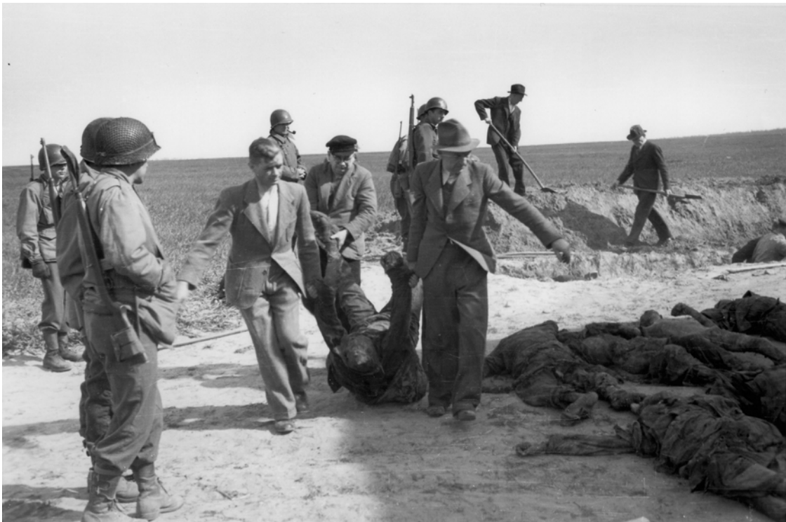
Abb. 5: Unter der Aufsicht amerikanischer Soldaten bestatten Männer aus Gardelegen die Leichen des Massakers.

Soldaten diese Männer bei ihrer Tätigkeit, die sie sehr anzustrengen scheint.