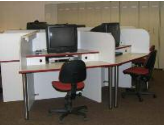
Videoarbeitsplätze der UB