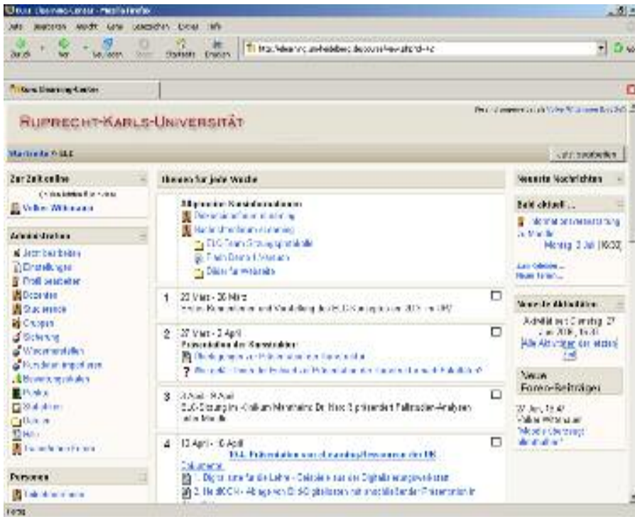
Abb. 2: Beispielkurs des E-Learning-Centers

Auf einer einfach benutzbaren Oberfläche bietet Moodle vielfältige Lernaktivitäten und interaktive Kommunikationselemente. Moodle simuliert dabei klassische Instrumente zur Seminarbegleitung (Seminarplan, Teilnehmerliste, Literaturliste oder Handapparat) im Netz und stellt Tools zum kollaborativen Lernen zur Verfügung.