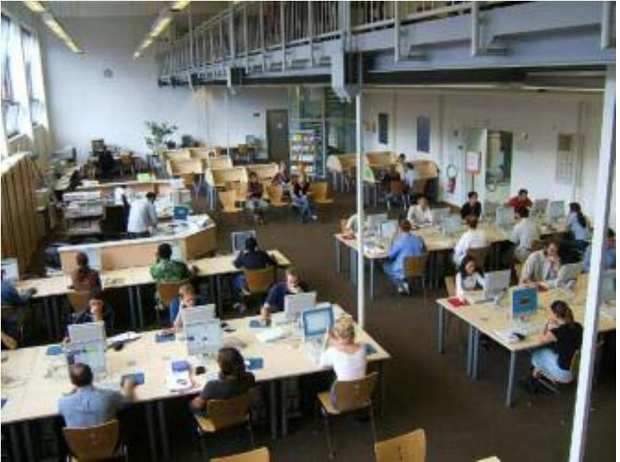
Medienzentrum der UB