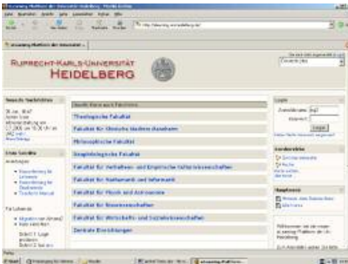
Abb. 1: Moodle-Startseite der Universität Heidelberg

Die Einführung von Moodle – Modular Object-Oriented Dynamic Learning Environment 2 – im Sommersemester 2006 ist damit innerhalb nur weniger Wochen zu einer Erfolgsgeschichte herangereift. Moodle wird mittlerweile in nahezu allen Fakultäten der Universität Heidelberg als zentrale Plattform für den Einsatz von E-Learning genutzt.