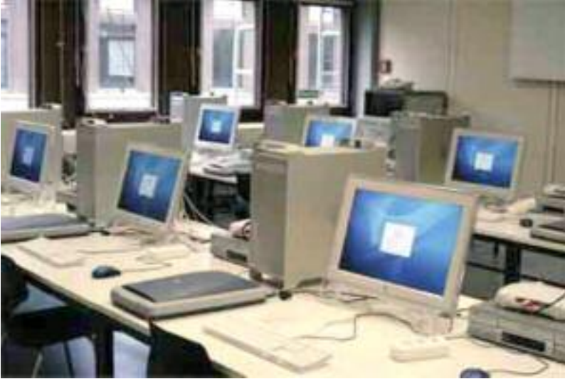
Medienzentrum des Rechenzentrums